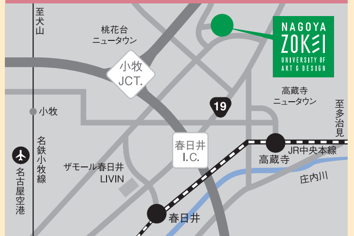
春日井駅 (JR中央本線)